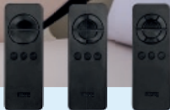
Verstelbare Bedbodem 1M