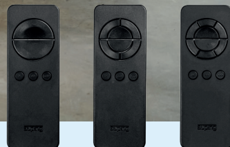
Sommier électrique 1M