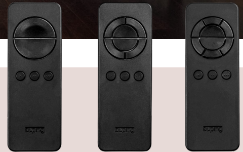
Smart Base 1M